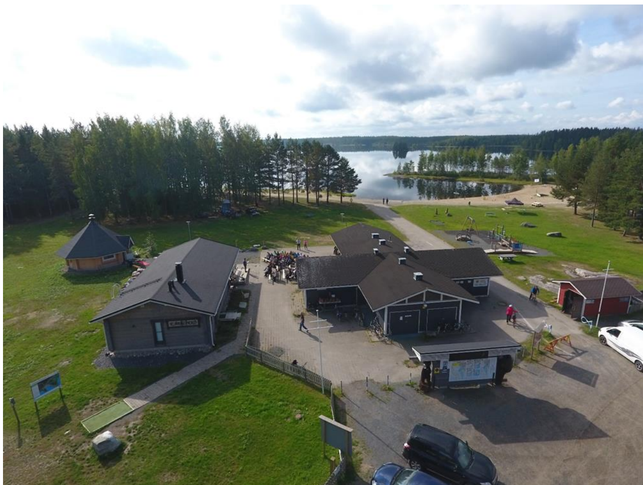
Kuva Luontotalo Kämpälikkö, Sirius kota, kaupungin uimarannan pukutilat vessat ja pelivälineet sekä frisbeegolf aloituspaikka

Luontotalon ja Sirius kodan omistaa Lakeuden Elämysliikunta ry